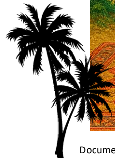
Document d'accompagnement pour la lecture de Pauline , d'Alexandre Dumas – édition Flammarion, « Etonnants Classiques » - ISBN : 978-2-0804-2550-8